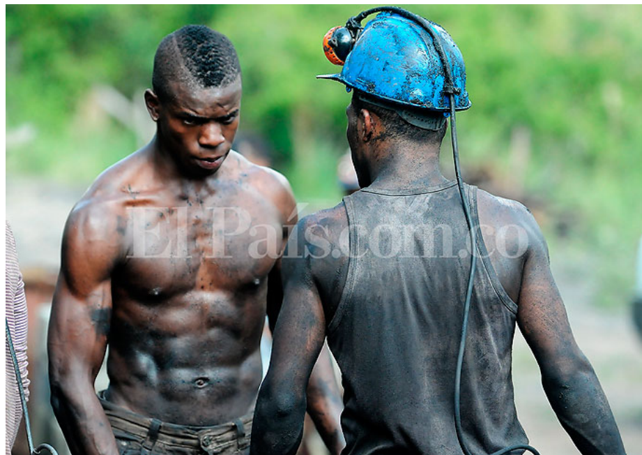
( elpais/sites/default/files/2014/11/informe-mineria-1.jpg )

Duras jornadas de trabajo cumplen los mineros de carbón que pican las vetas a 50 o más metros de profundidad, en jornadas que pueden superar las ocho horas diarias.