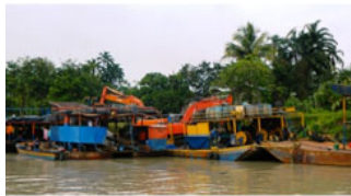
Se pretende utilizar un sistema de rastreo para toda la maquinaria que ingrese al país, con el fin de evitar el contrabando

Hay 30 mil millones de pesos disponibles para la formalización de la minería.