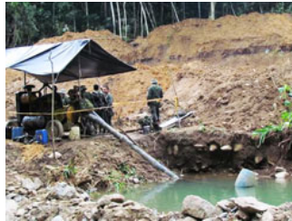
En Colombia existen 14.357 Unidades de Producción Minera (UPM), el 56 por ciento de las cuales declara no tener ningún tipo de título minero.

En efecto, en su informe Minería de Hecho en Colombia – publicado en diciembre de 2010 – la Defensoría nota que “legalizar una actividad minera, para los pequeños mineros puede ser un proceso tortuoso y de alto costo en tiempo y dinero, frente a las limitadas ventajas que ofrece... Además, en las áreas remotas donde trabajan, el gobierno nacional y las autoridades territoriales generalmente carecen de capacidad para regular, controlar o apoyar estas actividades distantes.”