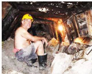
En 1994 se logró que un 14,5 por ciento de la minería sin título se formalizara.

Otro intento importante se dio en 1994, cuando el gobierno ofreció a los mineros informales la posibilidad de legalizar su labor y al mismo tiempo de acceder a créditos, a asistencia técnica y otros programas de apoyo oficial. Para acceder a estos incentivos se requería diligenciar un formulario que recibió el nombre de título minero . Se logró que un 14,5 por ciento — es decir, 566 solicitudes — formalizara su actividad.