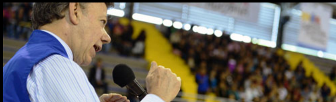
"Minería criminal" es "el combustible de buena parte de la violencia en el país": Juan Manuel Santos.

La distinción es esencial y sin embargo las fronteras son borrosas. Un recuento preciso y resumido de los intentos, los fracasos y las medidas recientes del gobierno para “formalizar” a los “artesanales” y perseguir a los “criminales”. ¿Será que no los confunde?